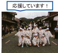
ダンスパフォーマンス