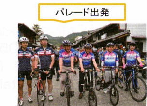
(旧今井住宅前)パレードスタート地点

④ 藍川団地南T字交差点 右折 団地の坂を下った所を右折。 スピードにのったテクニックが見もの。