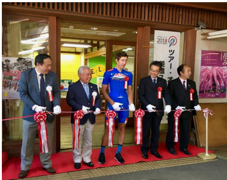
(2018 TOJ特別展 テープカット)