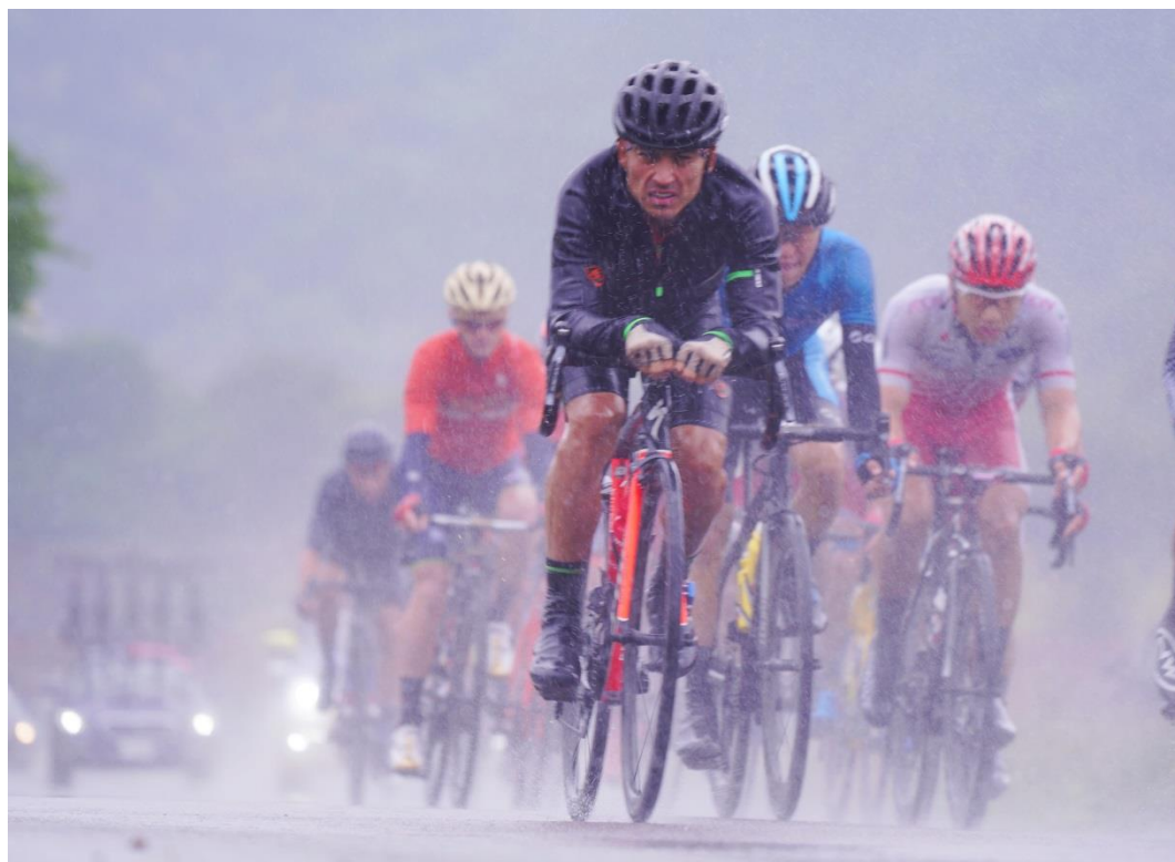
(水しぶき；2018フォトコンテスト優秀作品)