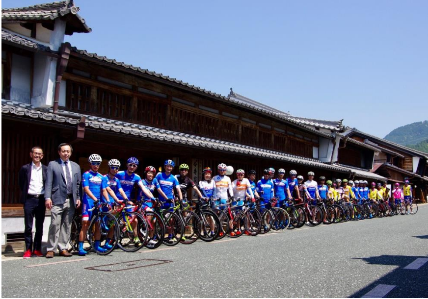
(2018愛三工業RTと走るファンランド)

国際ロードレース ツアー・オブ・ジャパン美濃ステージコースを、ホームチーム愛三工業RT選手と共に、走りませんか。